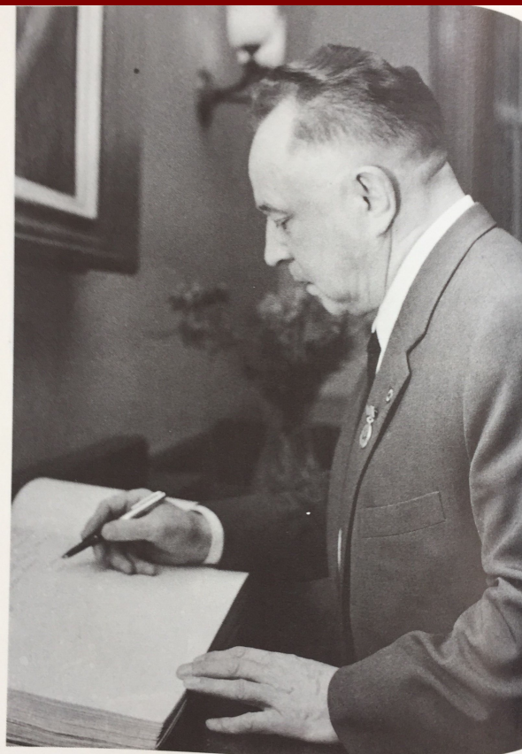
Erich Mielke in Eisleben anlässlich des 50. Jahrestages der Märzkämpfe 19. März 1971