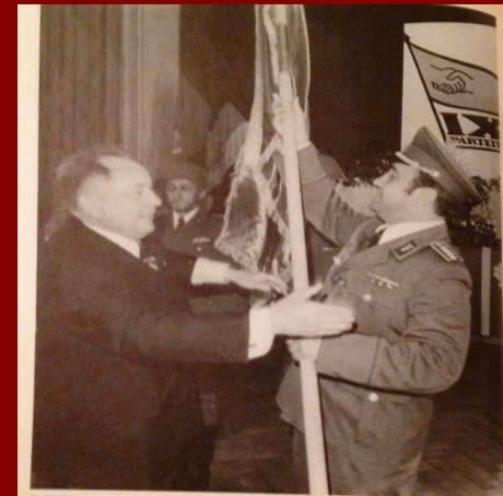
Erich Mielke übergibt dem Grenzzollamt Marienborn/Autobahn ein Ehrenbanner des Zentralkomitees der SED 13. Mai 1976