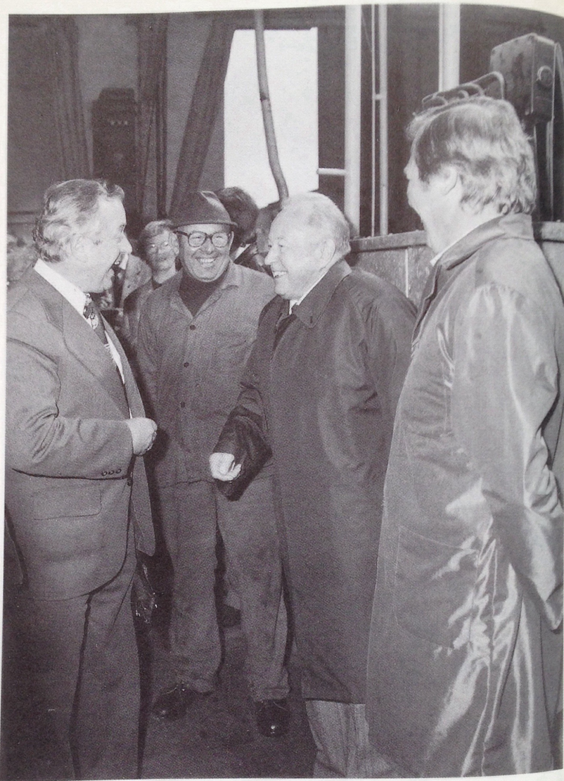
Erich Mielke als Kandidat für die Wahlen zur Volkskammer der DDR bei den Genossenschaftsbauern der LPG Pflanzenproduktion Teuchern, Kreis Hohenmölsen 4. Juni 1986

Erich Mielke als Kandidat für die Wahl zur Volkskammer